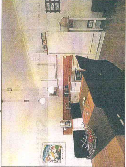
Auch in der Wohnung 13 befindet sich eine großzügige Pantry-Küche.