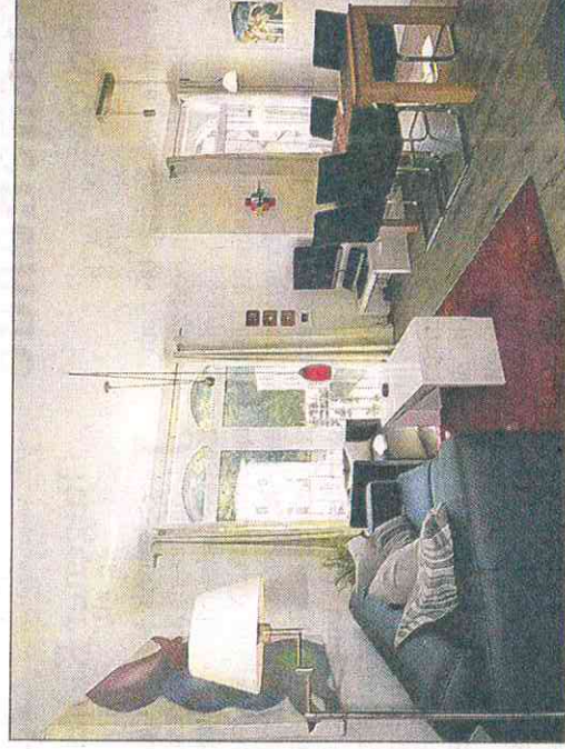
Das Wohnzimmer in der Wohnung 13 lädt ein und verspricht ein tolles Urlaubsgefühl während eines Aufenthaltes.