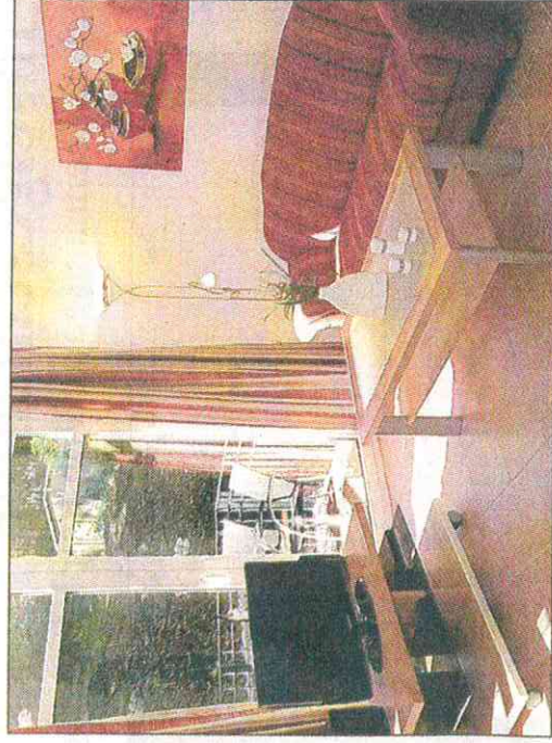
Ein Blick in den Wohnbereich der Wohnung 12 in der Villa „Lena“ – Wohlfühlen garantiert!

Bauherr Tim Fries übergibt 16 hochwertige Ferienwohnungen an Eigentümer