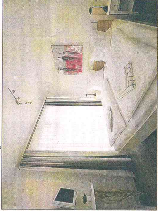
Das Schlafzimmer in der Wohnung 13 ist mit viel Liebe und Blick fürs Detail eingerichtet worden.